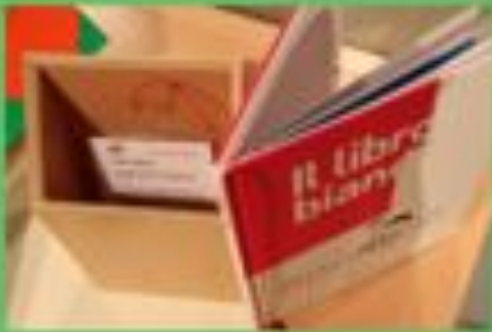
LIBRI SENZA PAROLE